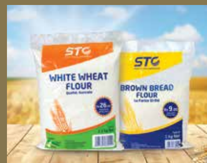
BUDGET 2017-2018: BAISSE DU PRIX DE LA FARINE - LE DEMI-KILO PASSE DE RS 5.85 À RS 4.85