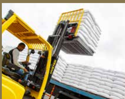
AMÉLIORATION DU SERVICE D'ENTREPOSAGE ET DE L'ESPACE DE STOCKAGE